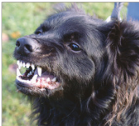
Vad händer om man går på den här hunden fysiskt??

RESPEKTERAS. Vattnet eller skramlet används endast för att bryta valpen som valt bort att lyssna på Nej. Direkt den brutit sitt önskade beteende jobbar jag in hunden och visar på vad som är RÄTT sätt att agera på istället.