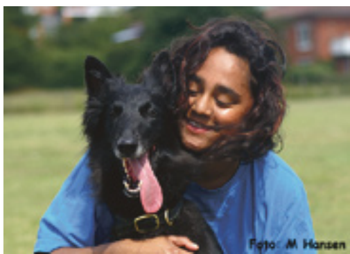
En bra relation mellan hund och ägare innebär ömsesidig kärlek och respekt

gör ont i hjärtat men ibland kan detta vara tvunget för att få en hanterbar och trevligare relation med sin bästa vän.