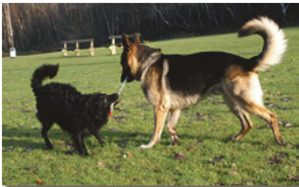
En dominant hund rör sig värdigt, en underlägsen fjäskar.

Jag har studerat våra hundar och deras flockstruktur många gånger, jag har även tittat på andras hundar. Det finns inga så bra läromästare i hundrelationer som just dom själva ;-)