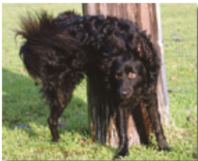
En hane som gärna kissar högt och ofta...

Många hanhundar som behöver "sättas mer ledarskap på" skvättmarkerar mycket på promenader.